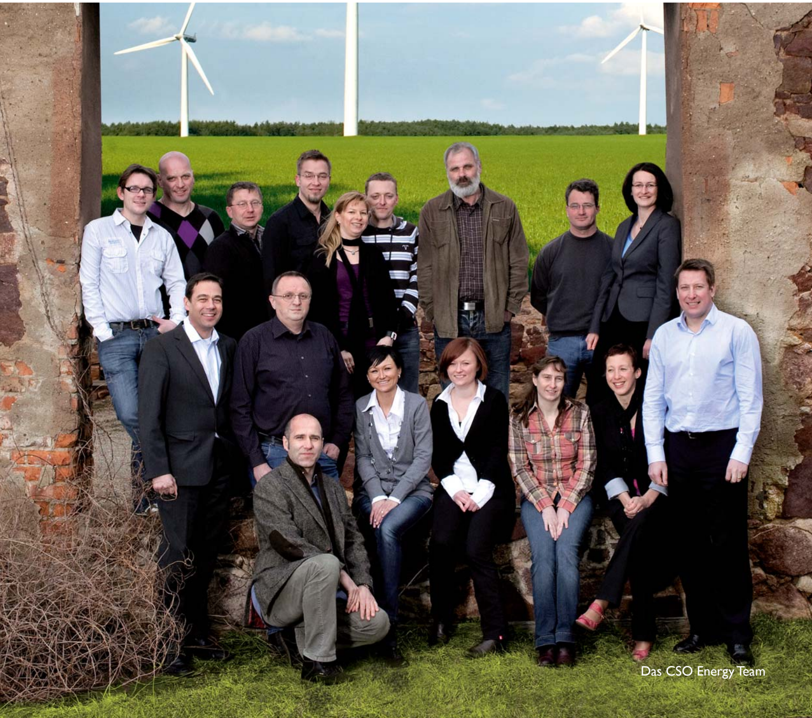
Das CSO Energy Team